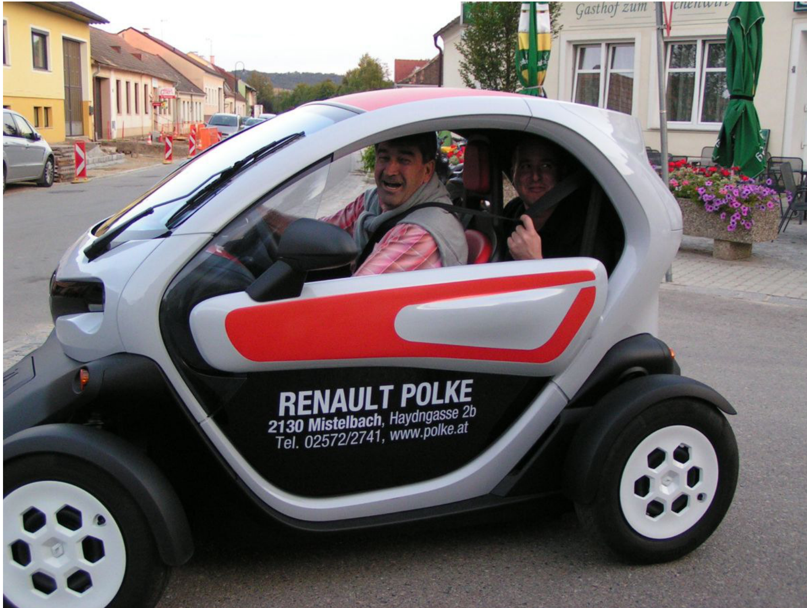
Der Twizy fand schnell seine Fans...