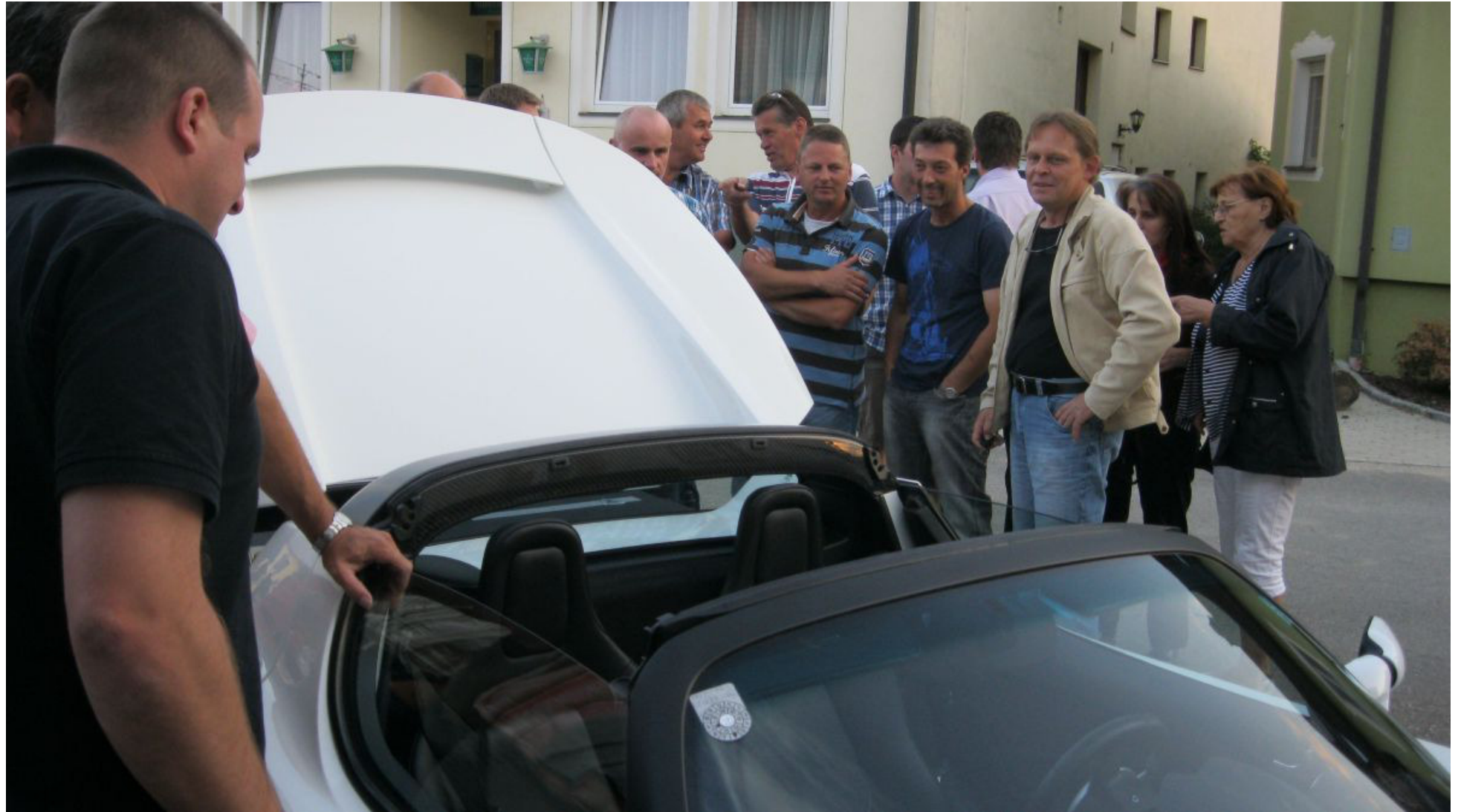
Beeindruckend die Fahrleistungen des Tesla Roadster....